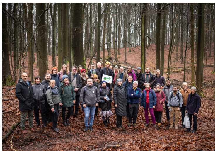
Semināra dalībnieki Schorheihe –Chorin BR