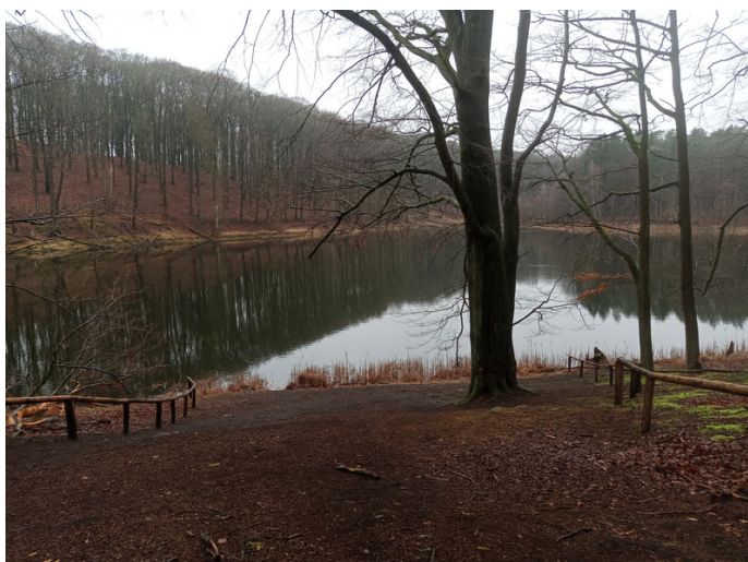
Schorheihe-Chorin BR ainava pie UNESCO Pasaules dabas mantojuma objekta

Seminārā bija pārstāvēta Spānija gan no biosfēras rezervāta, gan pētnieku puses, gan arī nacionālās MAB komitejas.